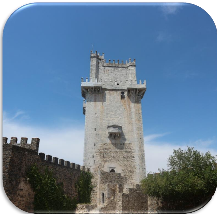
Torre de menagem do castelo de Beja