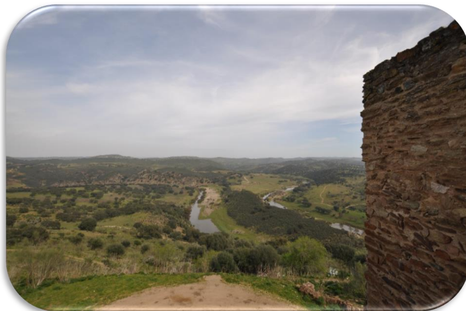
Castelo de Noudar - Barrancos